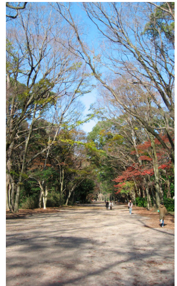
下鴨神社にて

ることが不可能な高額商品を、分割払いで利用できることがリース契約の利点ですが、支払総額や契約条項に注意しないと、後々紛争になることもあるので、よくよく気をつけてご契約ください。