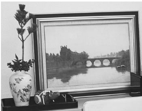
さつき事務所のお正月〜いただいた柿右衛門と絵画

今年が皆さまにとって良き年になりますように。さつき事務所を今年もよろしくお願ひします。