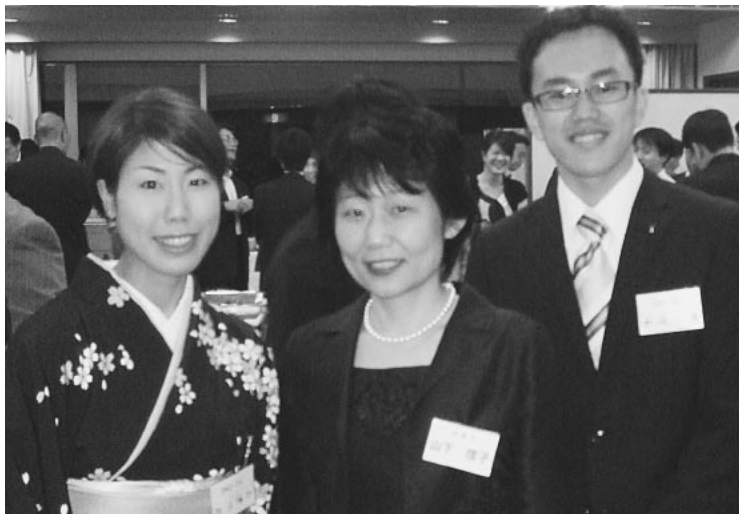
修習生謝恩会にて

最近は、やはり経済本です。 『強欲資本主義ウォール街の自 爆』、『サブプライム後に何が起 きているのか』、『サブプライム 問題の正しい考え方』、『21世 紀の富国論』、『戦後日本経済史』 (読書家のウッチーに借りました)、 『週刊ダイヤモンド 銀行・ 証券氷結』(これもウッチーに