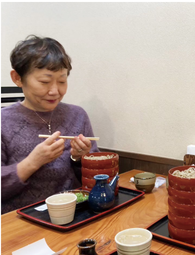
2023年秋、司法研修所同期の友人らと @出雲のお蕎麦や

最近、定期預金を解約する顧客に対し、使い途を聞くのが銀行実務になっているようです。